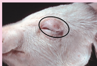
Big met dikke oogleden >