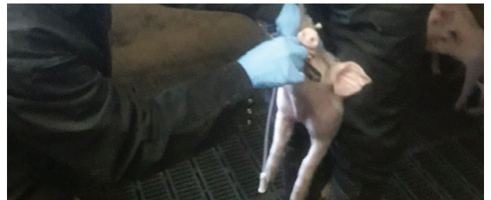
▲ Tracheobronchiale swabs.

In de praktijk zal het er vaak op neerkomen dat als je echt een goed beeld wilt krijgen van de kiem(en) die de hoest en/of longontsteking veroorzaken je 2 of misschien wel 3 onderzoekstechnieken nodig hebt. Bijvoorbeeld tracheobronchiale swabs in combinatie met sectie van aantal dieren danwel in combinatie met bloedmonsters. Deze resultaten samen geven vaak pas een goed beeld van de kiem die primair verantwoordelijk is. 📌